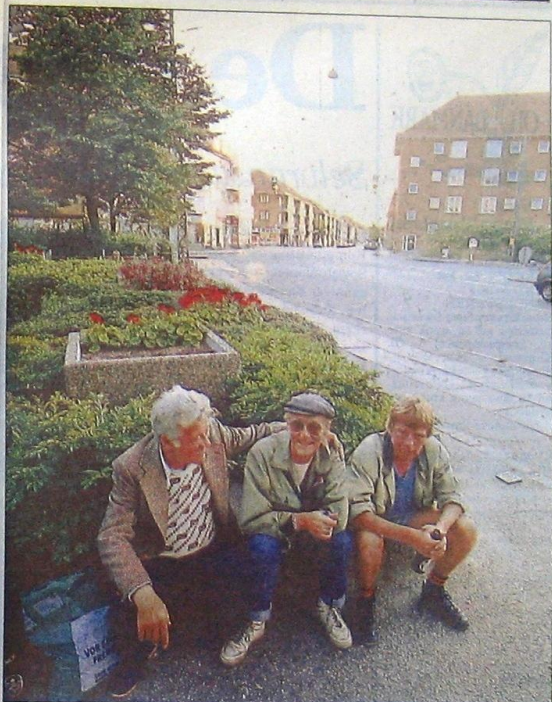
71 procent af alle lejligheder i Sydhavnen er ét- eller to værelser.

Haveforeningerne med de idylliske og vejløjede kolonihaver er der en håndfuld af. De fleste er fritids-andehuller for københavnere fra andre dele af byen. Men i