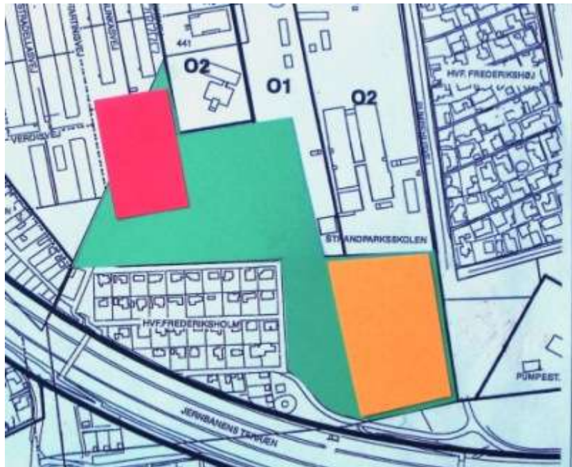
(2) Bygge- og Teknikforvaltningens forslag.