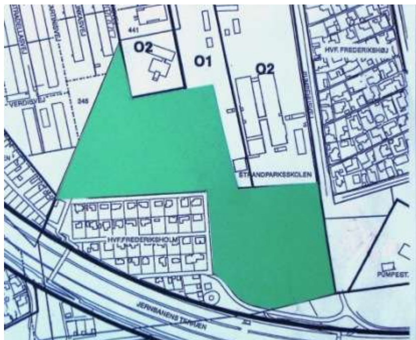
(1) Det nuværende naturområde.