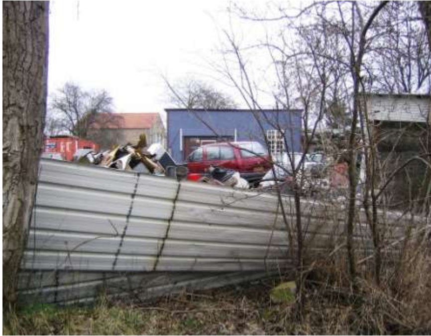
(4) Autoophuggerne ved Pumpehusvej.